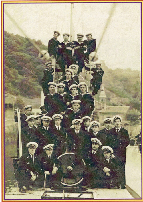
La mayor parte de la tripulación posa sobre cubierta