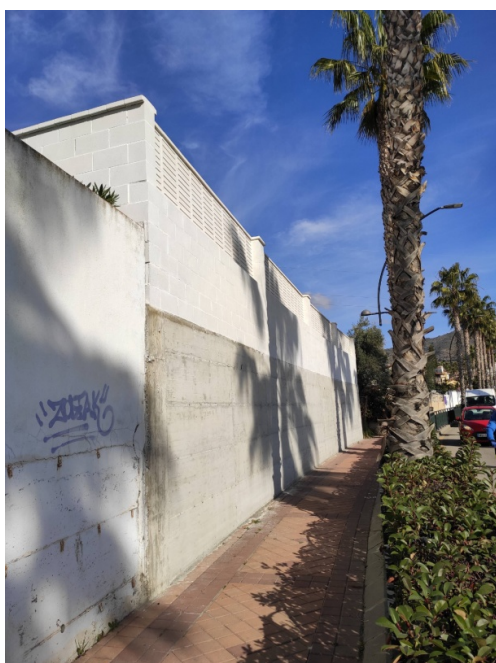
Img 4. Muro colindante con parcela C/ Trébol, Nº 14

Los muros colindantes, en su punto de encuentro con el muro alineado al vial, tienen una altura de 4,45 metros. Ambos elementos están compuestos, en su parte baja, por un muro de contención de 2,40 metros, y en la parte alta, un muro de bloques de hormigón, de 2,05 metros, en este caso sin celosía de hormigón.