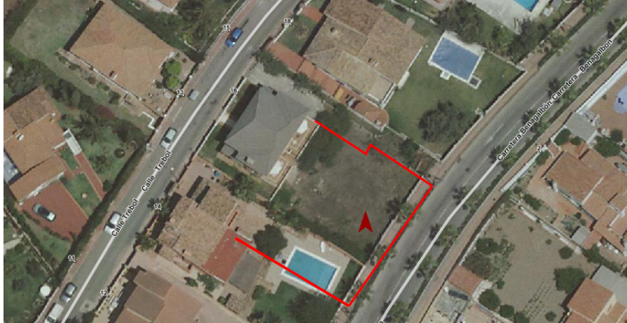
Img2. Plano de situación de los muros ejecutados antes de la

El muro alineado al vial, situado en la Carretera de Benagalbón, tiene una altura total de 4,45 metros, siendo la parte baja un muro de contención de una altura de 2,40 metros y sobre él, un muro de bloques de hormigón de 2,05 metros. Este muro de bloques de hormigón está construido, a su vez, en su parte inferior por bloques de hormigón hasta una altura de 1,20 metros y sobre esto, una celosía de hormigón de 0,85 metros y, todo ello, coronado con una albardilla.