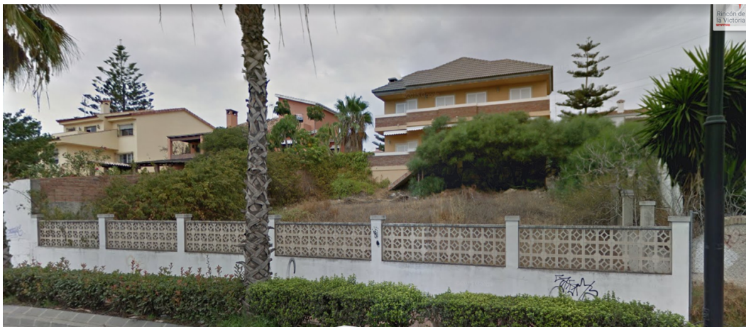
Img 8. Parcela antes de la ejecución de las obras.

Previamente a la ejecución de las obras el estado de la parcela, y de los muros referidos anteriormente, era el que se muestra en la siguiente imagen: