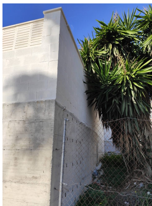
Img 5. Muro colindante con parcela C/ Trébol, Nº 18

La altura de 4,45 metros es la menor de todo el elemento, puesto que a medida que los muros avanzan por el interior de la parcela, incrementan su altura. En la imagen 6 podemos observar como han ejecutado un escalón, con los propios bloques de hormigón, que sube la altura del conjunto considerablemente.