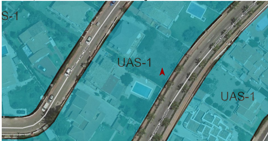
Img1. Plano de situación