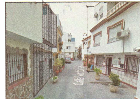
DOCUMENTACIÓN GRÁFICA DE LOS VOLÚMENES PROPUESTOS