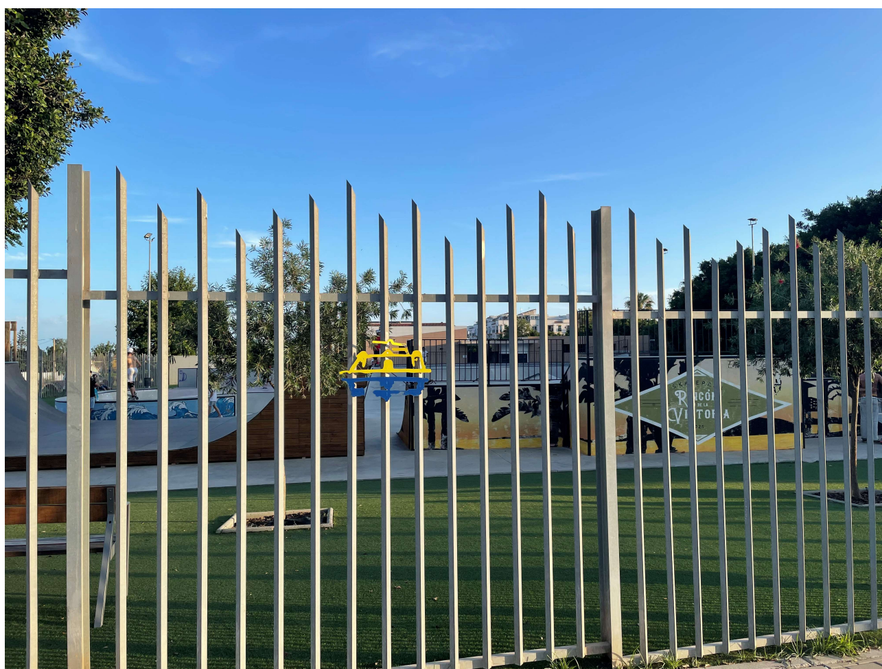
VALLADO PERIMETRAL DEL COMPLEJO DEPORTIVO CULTURAL Y MEDIOAMBIENTAL HUERTA JULIÁN, DONDE SE LOCALIZA EL SKATEPARK "IGNACIO ECHEVERRÍA".

El área de Juventud del Ayuntamiento de Rincón de la Victoria lanza una encuesta online para conocer las preferencias de los jóvenes sobre formación y ocio. La campaña denominada #tienesmuchoquedecir22 se realiza por segundo año consecutivo y está dirigida al colectivo juvenil de entre 14 y 35 años. La campaña denominada consiste en una encuesta 'on-line' a través de la herramienta Google Forms, donde los jóvenes tienen que responder e indicar sus preferencias en cuestiones sobre actividades formativas y actuaciones acordes a sus necesidades. La encuesta también contempla preguntas para conocer a los jóvenes «con la finalidad de adaptarnos a sus perfiles de comunicación».