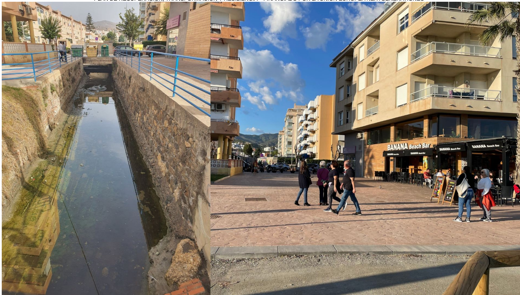
ANTES DE LA ACTUACIÓN Y TRAS LA INTERVENCIÓN