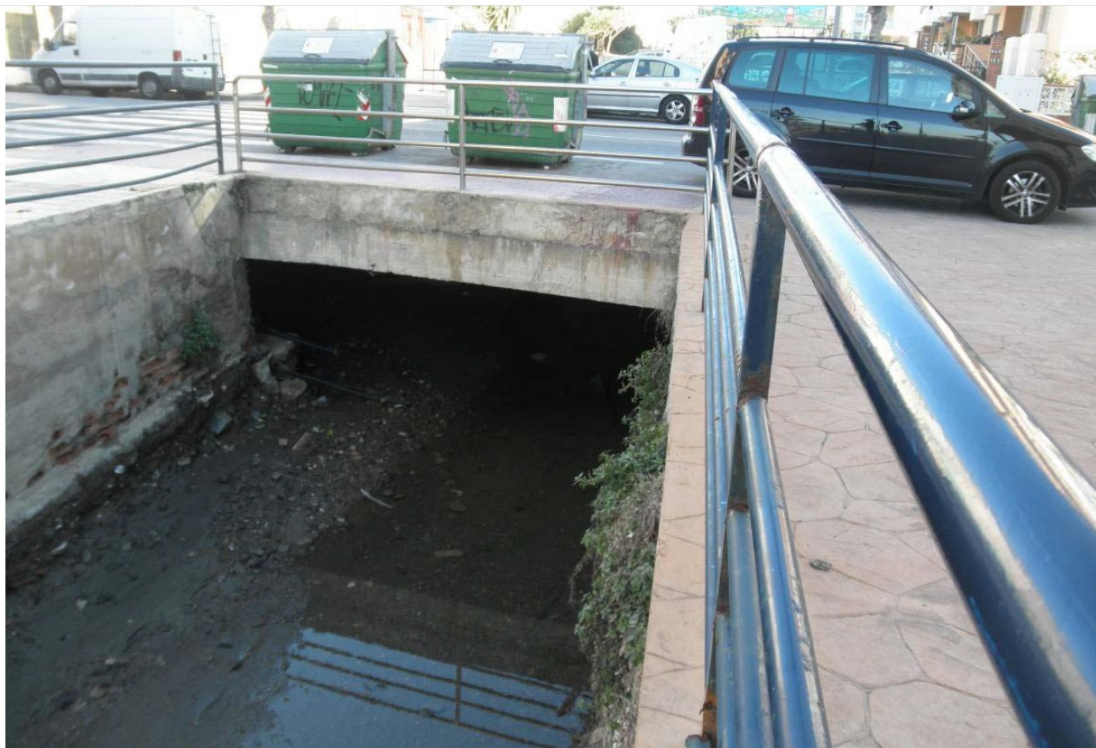
INICIO DE LA ZONA A EMBOVEDAR 2ªFASE, DE AGUAS ABAJO HACIA AGUAS ARRIBA