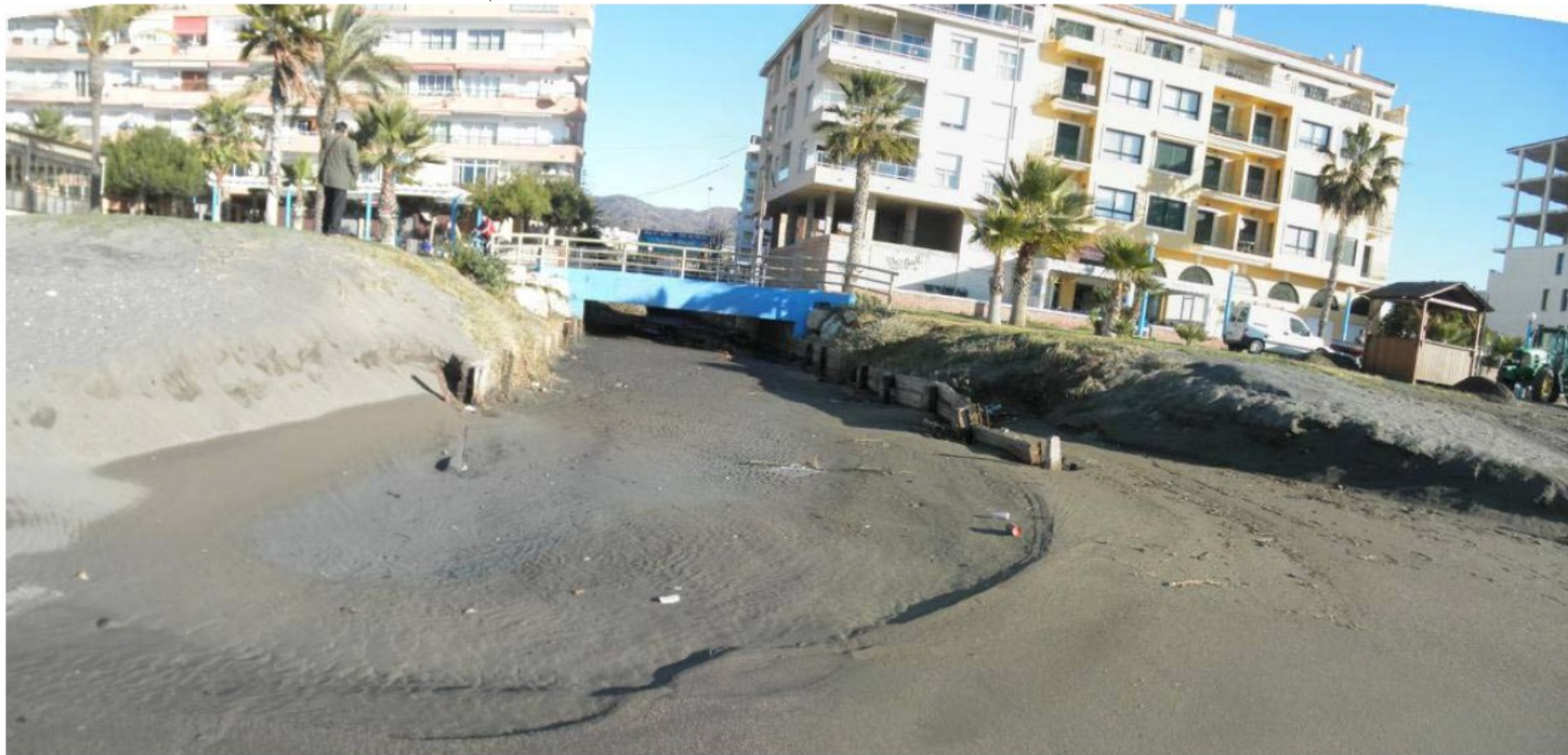
EL PUENTE DEL PASEO MARÍTIMO, DESDE LA PLAYA

PLAN DE RECUPERACIÓN, TRANSFORMACIÓN Y RESILIENCIA – FINANCIADO POR LA UNIÓN EUROPEA NEXTGENERATIONEU