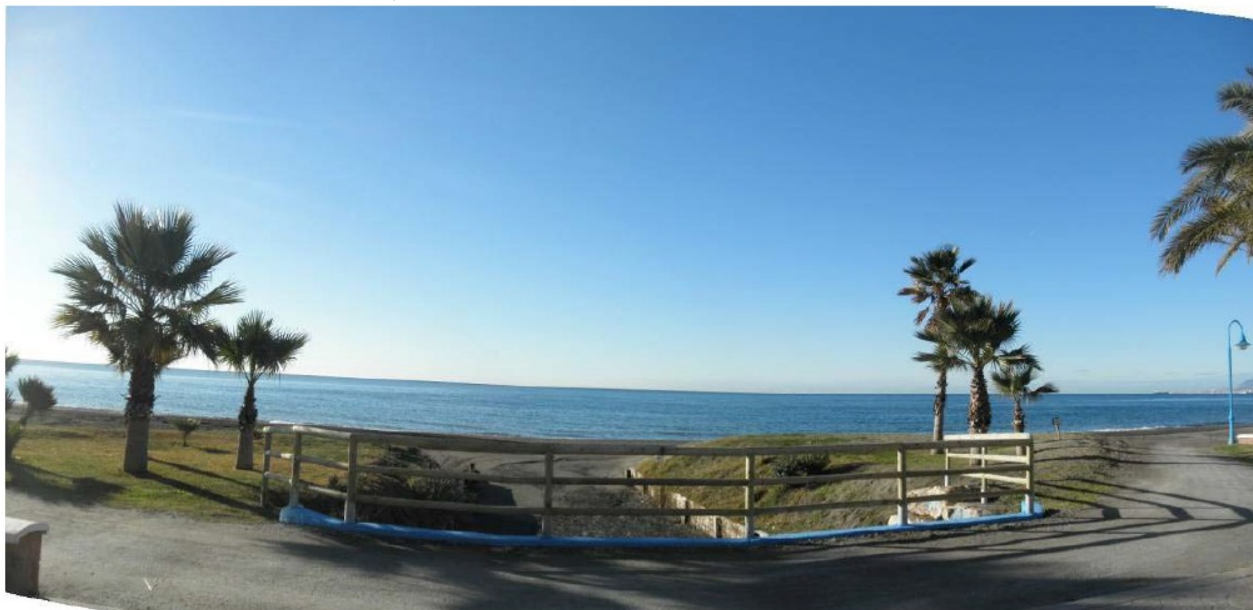
DESDE EL PUENTE DEL PASEO MARÍTIMO, HACIA LA PLAYA

PLAN DE RECUPERACIÓN, TRANSFORMACIÓN Y RESILIENCIA – FINANCIADO POR LA UNIÓN EUROPEA NEXTGENERATIONEU