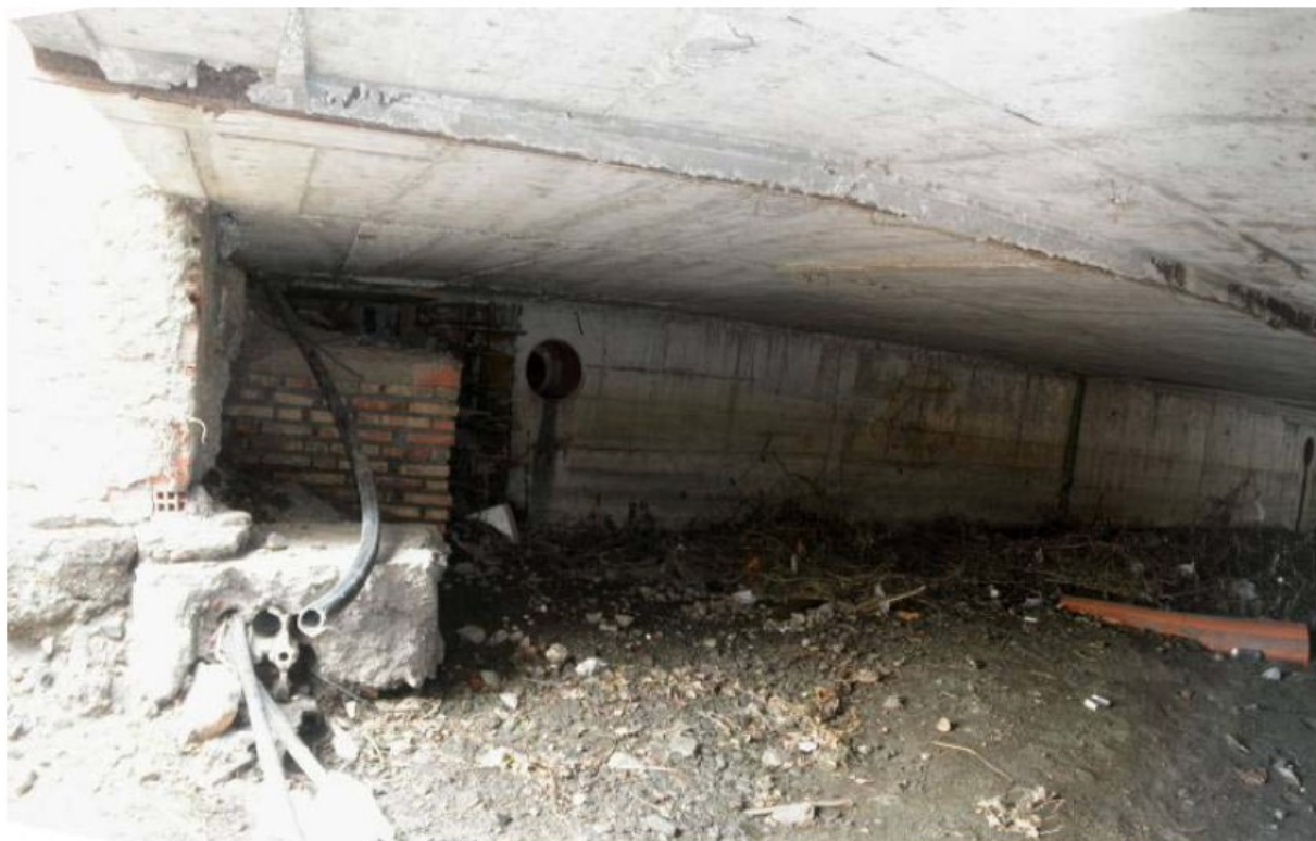
CAJÓN BAJO LA AVENIDA DEL MEDITERRÁNEO, DE AGUAS ABAJO HACIA AGUAS ARRIBA

PLAN DE RECUPERACIÓN, TRANSFORMACIÓN Y RESILIENCIA – FINANCIADO POR LA UNIÓN EUROPEA NEXTGENERATIONEU