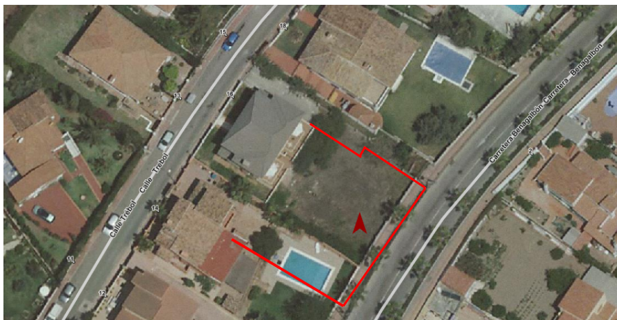
Img2. Plano de situación de los muros ejecutados antes de la

El muro alineado al vial, situado en la Carretera de Benagalbón, tiene una altura total de 4,45 metros, siendo la parte baja un muro de contención de una altura de 2,40 metros y sobre él, un muro de bloques de hormigón de 2,05 metros. Este muro de bloques de hormigón está construido, a su vez, en su parte inferior por bloques de hormigón hasta una altura de 1,20 metros y sobre esto, una celosía de hormigón de 0,85 metros y, todo ello, coronado con una albardilla.