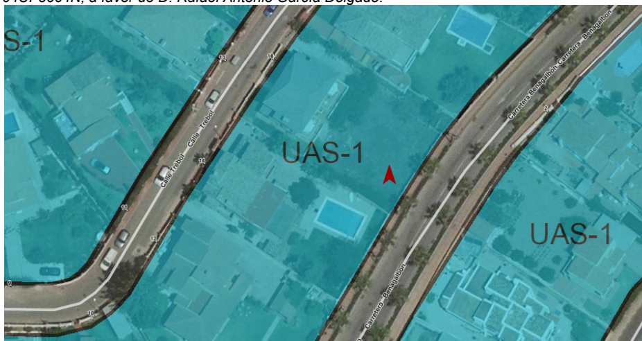
Imgl. Plano de situación